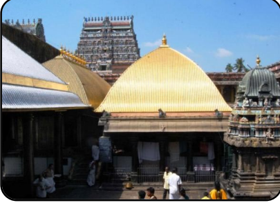
சிதம்பரம் நடராஜர் கோயில்