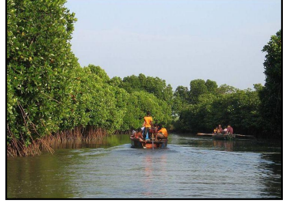
பிச்சாவரம் சதுப்புநிலக் காடுகள்